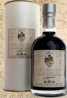
Aceto Balsamico di Modena. Armonia. 250 ml.