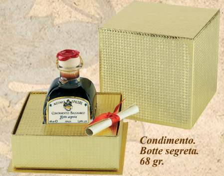
Condimento. Botte segreta. 68 gr.