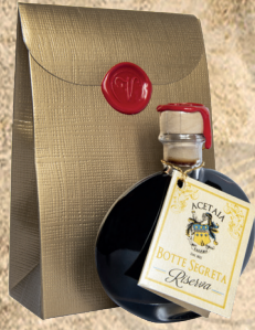
Condimento. Botte Segreta. Riserva. 40ml.