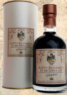
Aceto Balsamico di Modena. Desiderio. 250 ml.