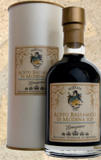
Aceto Balsamico di Modena. Emozione. 250 ml.