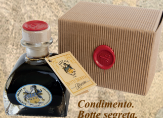
Condimento. Botte segreta. Riserva. 100 ml.